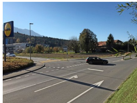
Die Kreuzung Strättligenstrasse/Moosweg (links): Hier will die Stadt einen neuen Kreisel bauen.

Die Gesamtkosten betragen gemäss Stadtratunterlagen 1,47 Millionen Franken. Die Hälfte davon betrifft die Strassensanierung und geht zulasten des baulichen Unterhalts. Dafür ist der