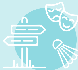
TOURISMUS/FREIZEIT, ERHOLUNG, KULTUR, SPORT